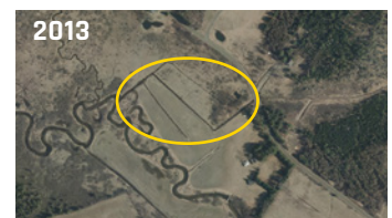
Cours d'eau d'origine naturel selon les photographies aériennes